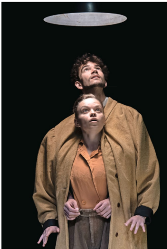
Le manteau offre «un terrain de jeu infini» au duo Mario & Mela, ici en répétition au Bilboquet. Alain Wicht

«Nous travaillons essentiellement avec cet élément-là, les deux dans un seul et unique manteau, sourit Adrien Bor-